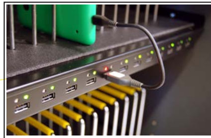
Während des Ladens